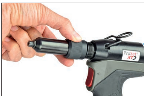
Carcasa de la boquilla y conjunto de mordazas de cambio rápido (sin herramientas)